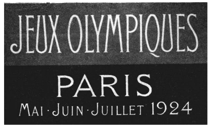
SPÉCIMEN D'ÉTIQUETTES A BAGAGES

principales maisons de gros et de détail, ou encore dispersées par avions.