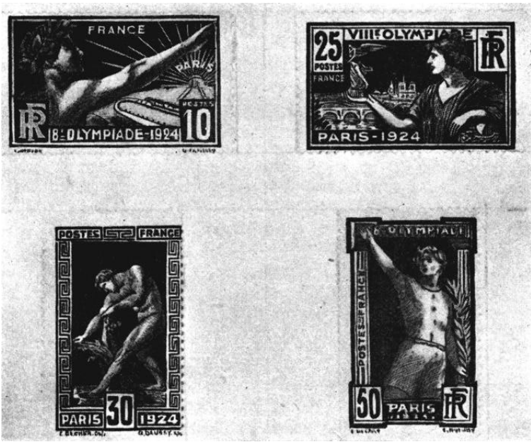
LES TIMBRES POSTAUX OLYMPIQUES

Ce n'est pas tout. 1.600.000 étiquettes à bagages, portant le nom des Jeux Olympiques, furent répandues dans le monde entier et utilisées par les grandes compagnies de navigation et de transports, par les principaux commissionnaires, les hôtels,