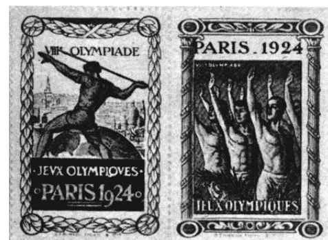
LES TIMBRES DE PROPAGANDE

Des vues aériennes furent prises par avions militaires, en