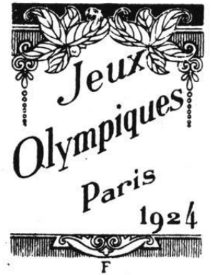
SPECIMEN DE PAQUETS A CIGARETTES

sies par le Comité Olympique et soumises à l'agrément du Sous-Secrétariat des P. T. T. ainsi que des commissions parlementaires. Enfin douze bureaux parisiens et cinq bureaux de province (Bordeaux, Marseille, Lyon, Lille, le Havre) reçurent des grilles spéciales d'oblitération, portant la mention « Jeux Olympiques, mai, juin, juillet 1924 ».